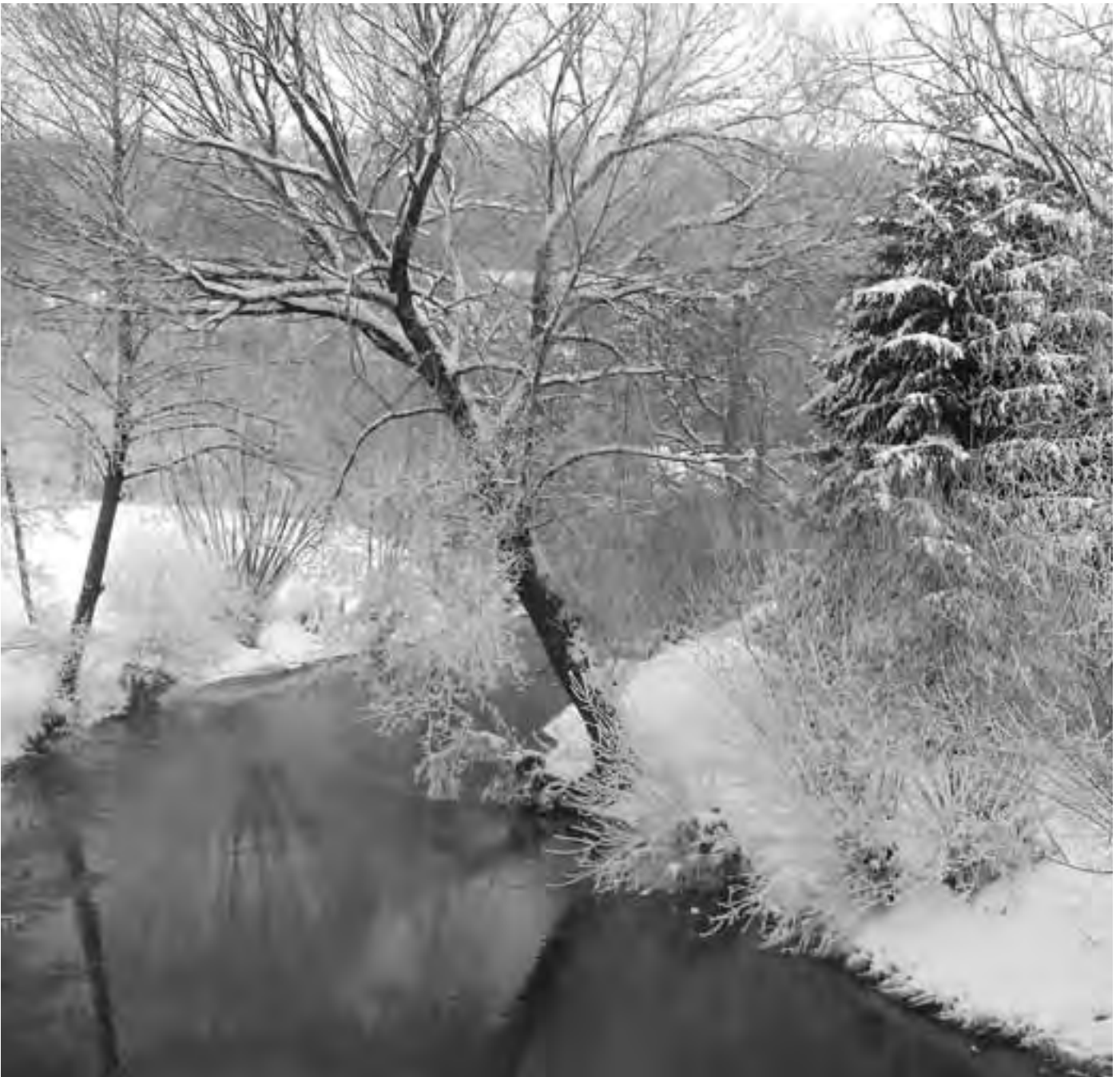
... letzten Winter am Weißen Main

Mitteilungsblatt der Gemeinde Ködnitz – Jahrgang 21 – Ausgabe 4 im Dezember 2011