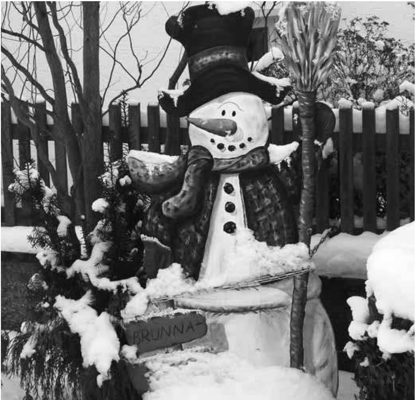
„Scheemann“ am Brunnen in Fölschnitz

Mitteilungsblatt der Gemeinde Ködnitz – Jahrgang 22 – Ausgabe 4 im Dezember 2012